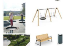
ДЕТСКАЯ ИГРОВАЯ ПЛОЩАДКА ДЛЯ МЛАДШЕГО ВОЗРАСТА (3-7 ЛЕТ)